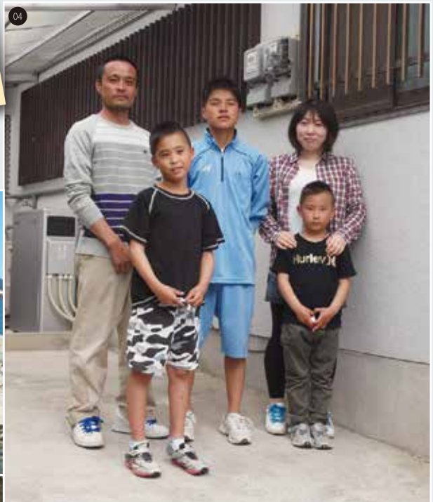
糸島市在住 山田さま 家族構成/ご主人 奥さま 長男(中3) 次男(小5) 三男(小1) <使用機器> 太陽光発電システム/ガリレオソーラーSR-200 蓄電池システム/東芝ENG-B6630AI