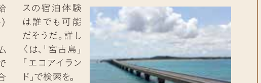
道を歩んでいるように感じる。また宮古島市では島全体をエネルギーパークと考え、産・学・官が連携して取り組む「エネトピア構想エリア」「バイオスタック構想エリア」「地下ダムエリア」「E3アイランド構想エリア」の施設を見学する新エネルギーを体感できる見学コースを設けているが、このツアーが国内外から視察団が訪れるほどの人気ぶりだといふ。

自然エネルギーは気象条件などで電気の出力にムラが出るのが難点だが、蓄電池に電気をためることで解決したという。宮古島の自然エネルギーの割合は、なんと約3割にも及ぶ。そのうち、原発の再稼働へ向けて迷走する本土をよそに、宮古島市はしなやかに我が