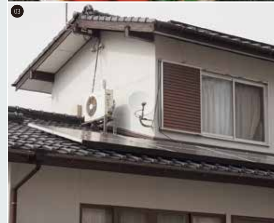
01.豊かな自然に囲まれた暮らしにここで移住する人も多い糸島市 02.海の幸と山の恵に恵まれた土地。新鮮な野菜の野菜は最高の贅沢 03.合計20枚の太陽光パネルで日々の電気をまかない発電できる 04.スポーツクラブのお父さんには子供さんみんな運動が大好きな山田家ご一家 05.蓄電池は省エネ効果を期待しています。と奥さま 06.天気の良い日はお得な夜間電力を蓄電池して昼間の家事に使えます。